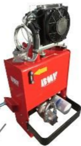
SERBATOIO 40 LT.