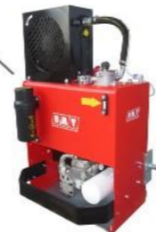
SERBATOIO 80 LT.