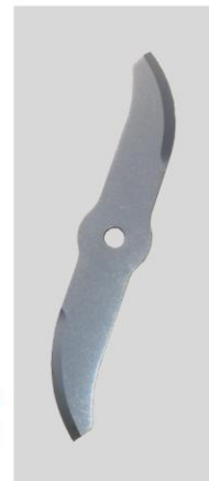
Coltello lucidato inox