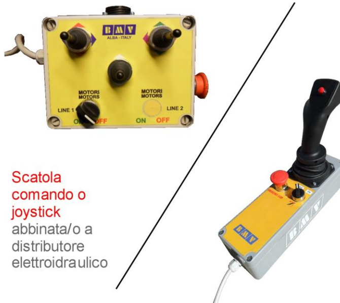
Scatola comando o joystick abbinata/o a distributore elettroidraulico