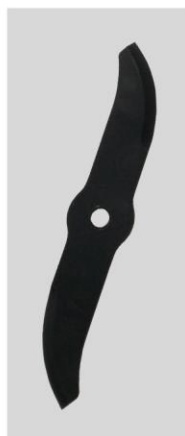
Coltello tipo sciabola